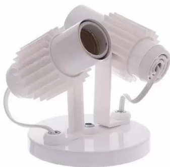
Spot 2 lâmpadas fluorescentes

Todas as luminárias deverão estar com as lâmpadas de led 15 w instaladas.