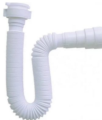
Sifão metálico tipo copo