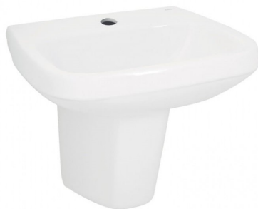
Lavatório com coluna suspensa