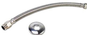
Ligação flexível para lavatório- 40cm – cromada